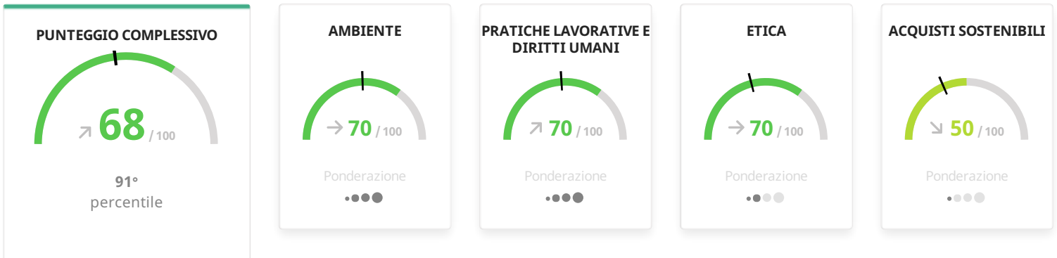
Distribuzione del punteggio complessivo

Performance di sostenibilità ● Insufficiente ● Parziale ● Buono ● Avanzato ● Eccezionale — Punteggio medio